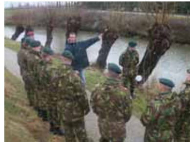
Militairen luisteren aandacht naar de verhalen

bestond dat anderen ook reeds de posten hadden verlaten, echter hadden die een te kort aan munitie en was het gekletter van geweschoten tot bijna nul gedaald. Na een gevaarlijke tocht, verzamelde de commandant samen met zijn reeds uitgedunde peloton zich op de commandopost. Hier keek men verbaast van op. Het duurde dan ook niet lang totdat iedereen werd gesommeerd terug te keren naar de stellingen. Standhouden! Vanuit het niets trad een soldaat naar voren. Zonder vrees nam de soldaat het peloton op sleeptouw. Gevolgd door zijn commandant liepen zij door de bossen. Aangekomen bij de waterloop, was de linie reeds in handen van de bezetter en sneuvelden tientallen militairen.