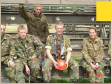
De genie en de landmachtdagen 2006