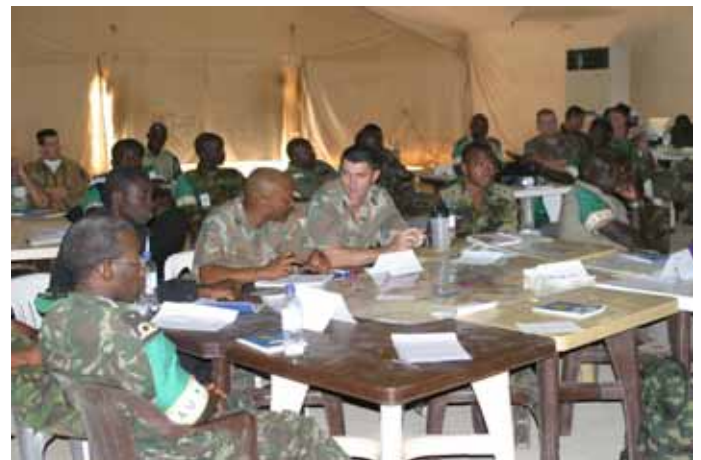
De lezingen worden vol aandacht gevolgd. Met de aangeboden stof moeten de cursisten zelf aan de slag tijdens de planningsopdracht en het voorbereiden en uitvoeren van de Command Brief.

Beide cursussen verlopen voorspoedig. De eerste cursus bevat 39 deelnemers, de tweede cursus telt zelfs 48 deelnemers. Beide cursussen hebben ook de belangstelling getrokken van autoriteiten. De hoogste diplomaat van de Verenigde Staten in Soedan en de Britse militair attaché in Soedan tonen hun belangstelling voor de cursus.