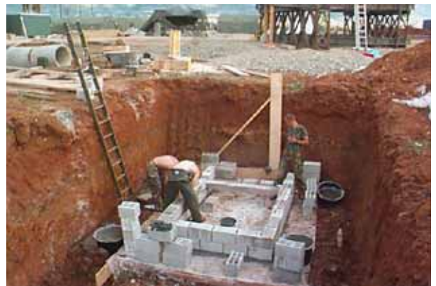
De bouw van een mineral olie- en vetafscheider, geplaatst bij een keukengroep. Hiermee wordt gravitaire scheiding toegepast. Met deze vorm van afvalwaterzuivering wordt het riool minder zwaar belast.

Met de komst van bepaalde tijd-functies wordt het personeel opgeleid met de huidige functieopleidingen basis A, pakket A en B. Met een opleidingsduur van respectievelijk 4,10 en 6 weken wordt van de functionaris het vereiste niveau verwacht