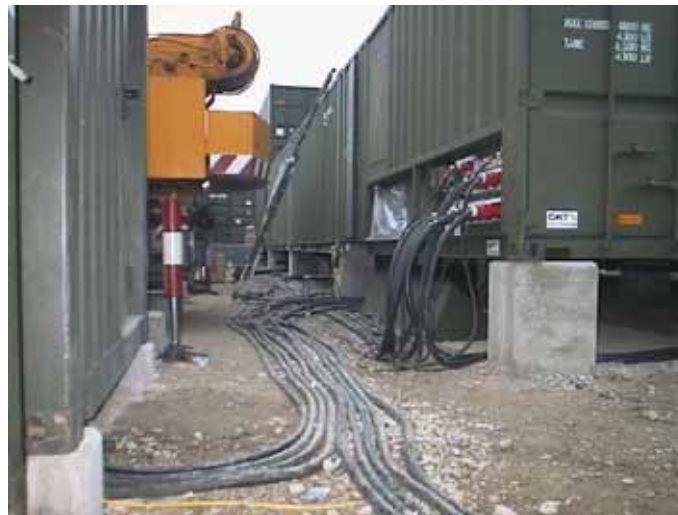
Energielevering t.b.v. de keukengroep, o,6 MegaWatt

Het technisch onderwijs wordt juist veel uitdagender gebracht dan vroeger. Dat zien we ook binnen ons eigen bedrijf waar meer verwacht wordt van het individu zelf. Neem E-learning , praktijkopdrachten uitwerken en presenteren, waarbij het accent meer moet liggen in het zelf ontdekkend leren. Wel dienen hiervoor de juiste randvoorwaarden te worden aangeleverd. Sinds kort beschikt de vakgroep over meetkoffers waarbij met praktijkopdrachten en computerondersteuning de basis-elektriciteitsleer wordt aangeleerd. Dit alles om een goede basis te creëren in het werken aan de militaire infra.