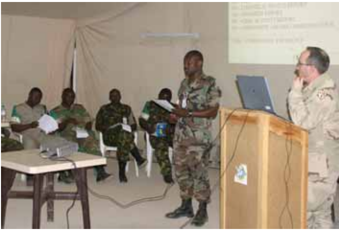
Het hoogtepunt van de cursus, het houden van een Command Brief waarin de daadwerkelijke situatie in de AO wordt gepresenteerd.

missie. Aan het eind van de planningsopdracht presenteren de vertegenwoordigers van de diverse functionaliteiten hun bevindingen en de planningscursus wordt afgesloten met het presenteren van een aantal mogelijke wijzen van optreden.