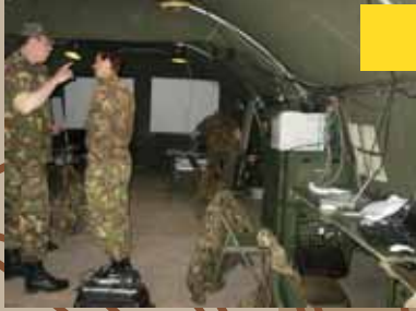
77 (kernstaf) Geniebrigade: van 'FOG' naar 'FOC'