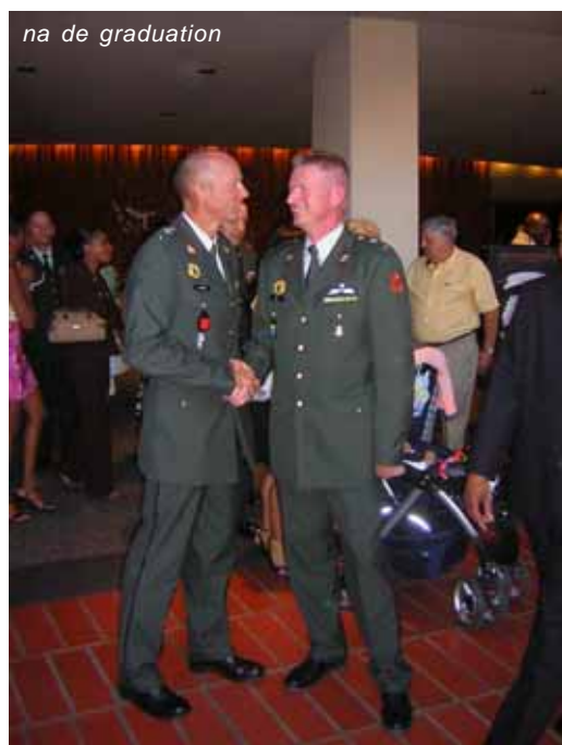
na de graduation