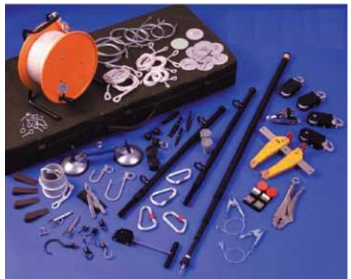
een foto van een hook and line set. Een vergelijkbare zit er in onze search team uitrusting

Er zal een definitieve behoefte moeten worden gesteld om genie eenheden in NLD te kunnen uitrusten. Dit geldt ook voor de basic search set voor de overige eenheden.