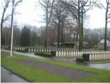
Ere begraafplaats de Grebbeberg

De ochtendnevel trekt langzaam op, wanneer de eerste zonnestrallen zich een weg banen door het wolkendek. Ondanks de regen betreden mannen in gecamoufleerde pakken de bossen op de Grebbeberg en luisteren aandachtig naar een gids. Cursisten van de primaire vorming genie volgen de Battlefield tour rond het voormalige strijdtoneel. Deze tour geeft een goede indruk van wat er zich hier tijdens de tweede wereldoorlog heeft afgespeeld.