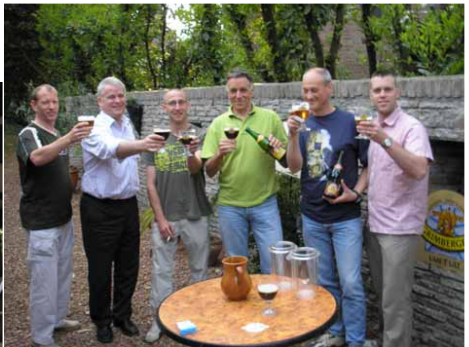
Beter één glas in de hand dan....geen hand

Natuurlijk werd de meeting op een passende wijze afgesloten met een glas Grimbergen. De twee dames op de bekende advertentiepagina waren toen al weg...!!