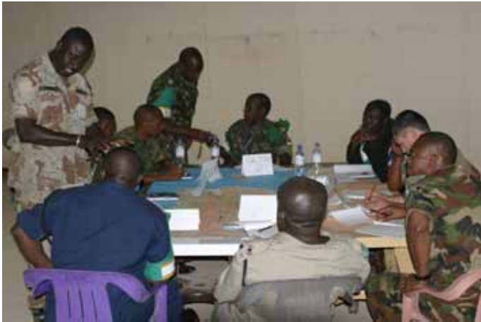
Tijdens de planningsopdracht wordt er druk overleggepleegd tussen de cursisten.

De bevolking in de vluchtelingenkampen kan zichzelf redelijk in stand houden. Het lijkt in onze ogen allemaal heel armoedig maar de kinderen benaderen ons met vrolijke en onderzoekende blikken. Ook de volwassenen begroeten ons op een vriendelijke wijze. Van honger is hier geen sprake. De bevolking bewerkt, weliswaar op primitieve wijze, zelf het land en heeft kudde met geiten, koeien en kamelen. Het levensonderhoud voorziet in de eerste