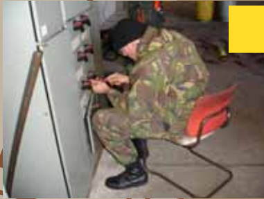
Oefening "KELP DRIVE" op de Falklands