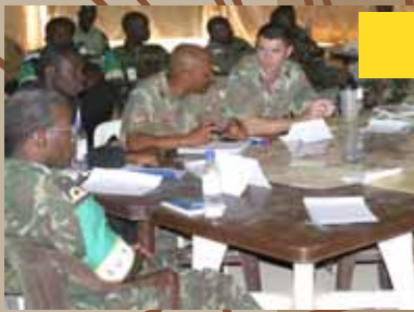
NATO Mobile Training Team in El Fashir, Darfoer