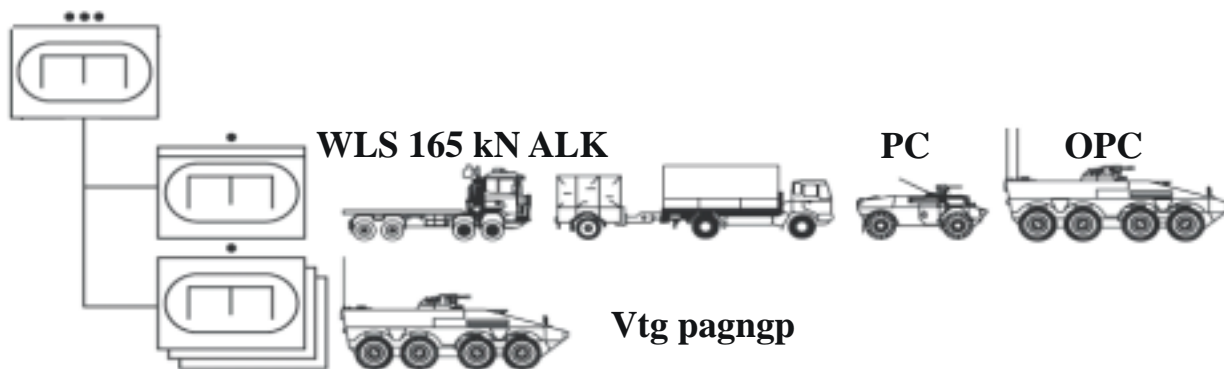
Figuur 2, Organisatie Pantsergeniegroep na instroom van voorzien materieel

kend en ook uitgebreid geoefend. Snel gaan de groepen naar hun objecten met een duidelijk kort aanvullend bevel. Zijn OPC, Sergeant-I Helmknop begeleidt in zijn gepantserde Boxer vrachtvoertuig het WisselLaad Systeem (WLS) 165 kN van het peloton. Met deze twee voertuigen zorgt hij dat de organieke voorraad kl V, beladen op het flatrack van het WLS, bij de diverse locaties komt.