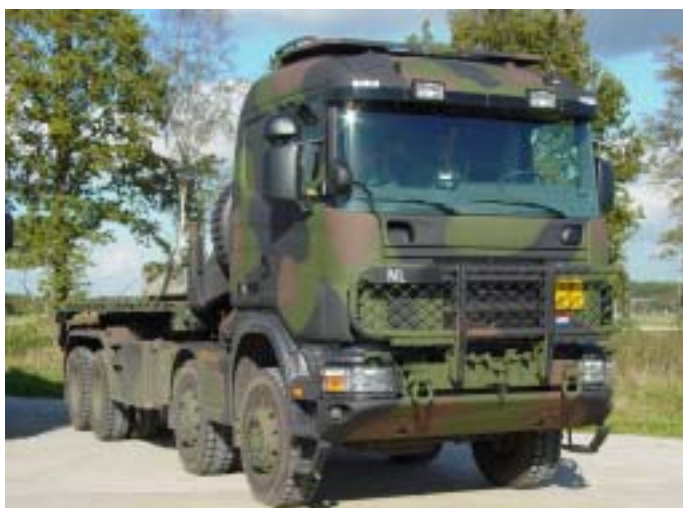
Figuur 3, Wissel Laad Systeem WLS 165kN in de Auto LaadKraan (ALK) versie

Ze hadden dit plan ook met de plaatsvervanger van het manoeuvreteam doorgenomen en het D-punt voor team en pantsergeniepeloton gekozen bij het Dorp Souflad. Bruinpat weet, dat hoewel hij veel bestelt (een volle