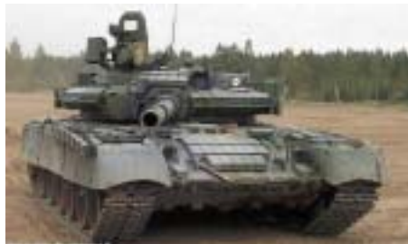
Figuur 1, T 80, Soedakije

Wat nu volgt heeft Bruinpat al ruim een week eerder met zijn OPC en groepscommandanten doorgenomen, ver-